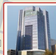
TKPガーデンシティ 広島 広島県広島市中区中町8-18 広島クリスタルプラザ 2～3階 (事務所・2階)